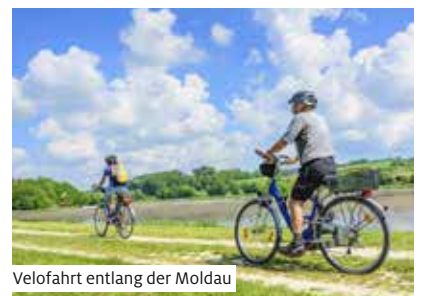
Velofahrt entlang der Moldau