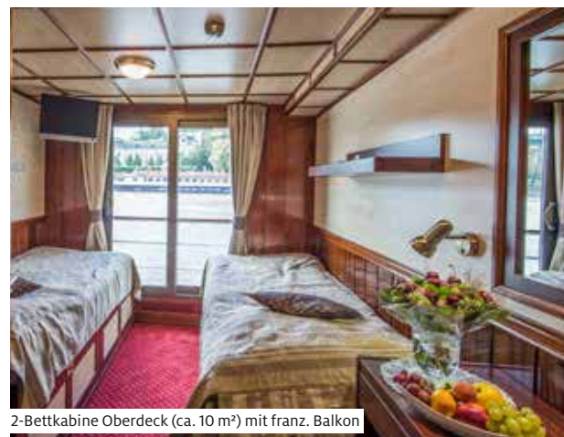
2-Bettkabine Oberdeck (ca. 10 m²) mit franz. Balkon