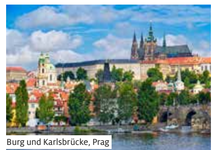
Burg und Karlsbrücke, Prag