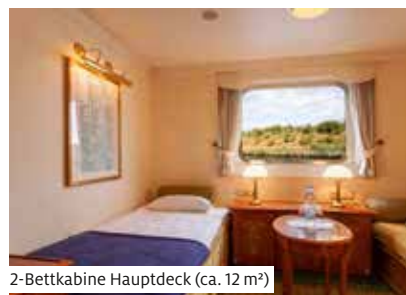
2-Bettkabine Hauptdeck (ca. 12 m 2 )