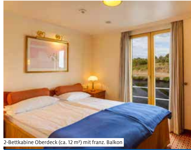
2-Bettkabine Oberdeck (ca. 12 m 2 ) mit franz. Balkon