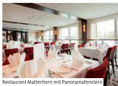
Restaurant Matterhorn mit Panoramafenstern