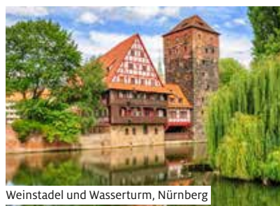
Weinstadel und Wasserturm, Nürnberg