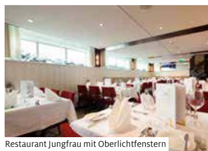
Restaurant Jungfrau mit Oberlichtfenstern