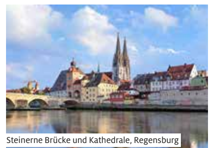
Steinerne Brücke und Kathedrale, Regensburg