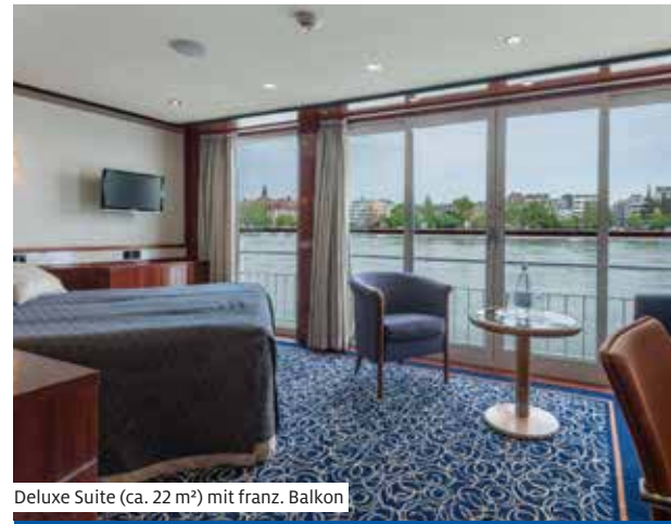
Deluxe Suite (ca. 22 m 2 ) mit franz. Balkon