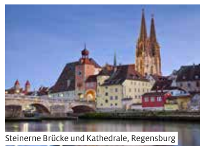
Steinerne Brücke und Kathedrale, Regensburg