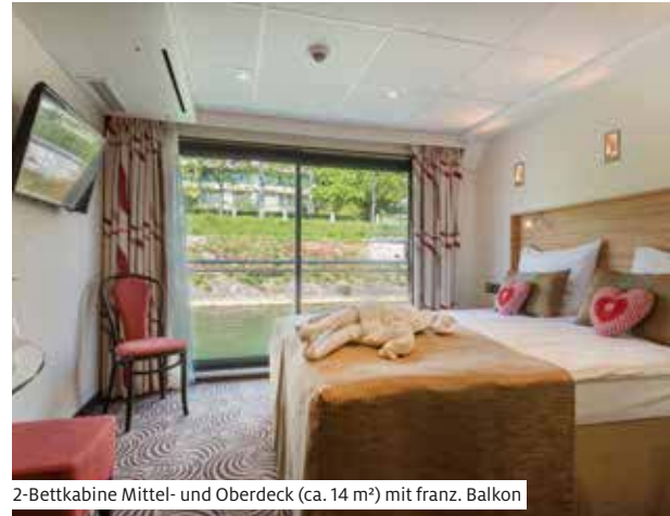
2-Bettkabine Mittel- und Oberdeck (ca. 14 m²) mit franz. Balkon