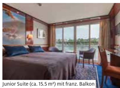
Junior Suite (ca. 15,5 m 2 ) mit franz. Balkon