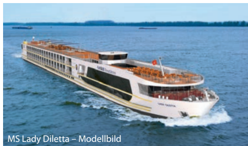
MS Lady Diletta – Modellbild