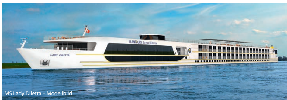
MS Lady Diletta – Modellbild