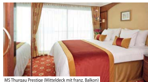
MS Thurgau Prestige (Mitteldeck mit franz. Balkon)

Bordausstattung: Foyer mit Réception, Shop, grosszügiges Restaurant, grosser Panorama-Salon mit Tanzfläche und Bar sowie der Sauna- und Fitnessbereich, Sonnendeck mit Whirlpool, Liegestühlen und Sonnenschirmen. Gratis WLAN nach Verfügbarkeit. Lift vom Mittel- bis Oberdeck. Nichtraucher-schiff (Rauchen auf dem Sonnendeck erlaubt).