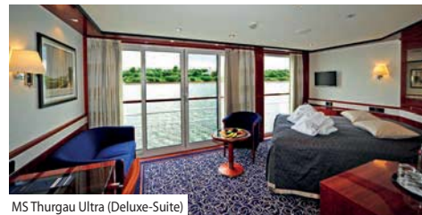
MS Thurgau Ultra (Deluxe-Suite)