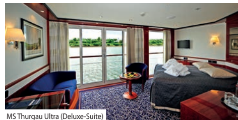
MS Thurgau Ultra (Deluxe-Suite)