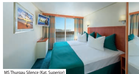
MS Thurgau Silence (Kat. Superior)