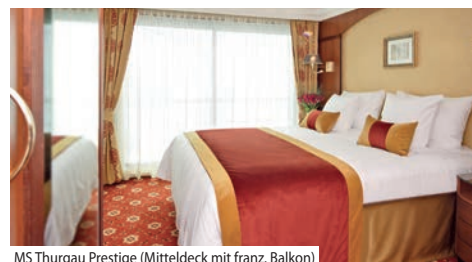
MS Thurgau Prestige (Mitteldeck mit franz. Balkon)

Bordausstattung: Foyer mit Réception, Shop, grosszügiges Restaurant, grosser Panorama-Salon mit Tanzfläche und Bar sowie der Sauna- und Fitnessbereich, Sonnendeck mit Whirlpool, Liegestühlen und Sonnenschirmen. Gratis WLAN nach Verfügbarkeit. Lift vom Mittel- bis Oberdeck. Nichtrauchererschiff (Rauchen auf dem Sonnendeck erlaubt).