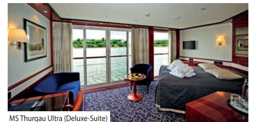
MS Thurgau Ultra (Deluxe-Suite)