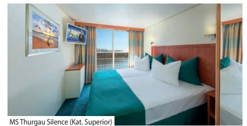
MS Thurgau Silence (Kat. Superior)