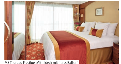
MS Thurgau Prestige (Mitteldeck mit franz. Balkon)

Bordausstattung: Foyer mit Réception, Shop, grosszügiges Restaurant, grosser Panorama-Salon mit Tanzfläche und Bar sowie der Sauna- und Fitnessbereich, Sonnendeck mit Whirlpool, Liegestühlen und Sonnenschirmen. Gratis WLAN nach Verfügbarkeit. Lift vom Mittel- bis Oberdeck. Nichtraucher-schiff (Rauchen auf dem Sonnendeck erlaubt).