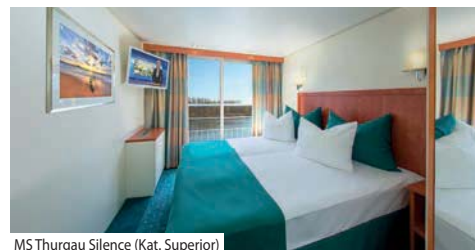
MS Thurgau Silence (Kat. Superior)