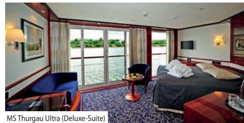
MS Thurgau Ultra (Deluxe-Suite)