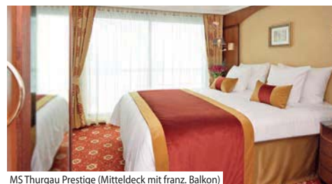
MS Thurgau Prestige (Mitteldeck mit franz. Balkon)

Bordausstattung: Foyer mit Réception, Shop, grosszügiges Restaurant, grosser Panorama-Salon mit Tanzfläche und Bar sowie der Sauna- und Fitnessbereich, Sonnendeck mit Whirlpool, Liegestühlen und Sonnenschirmen. Gratis WLAN nach Verfügbarkeit. Lift vom Mittel- bis Oberdeck. Nichtrauchererschiff (Rauchen auf dem Sonnendeck erlaubt).